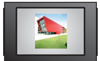
Imagen cuadrada Pinchar en el cuadrado para adjuntar imagen