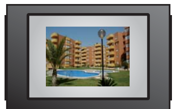
Imagen apaisada Pinchar en el cuadrado para adjuntar imagen